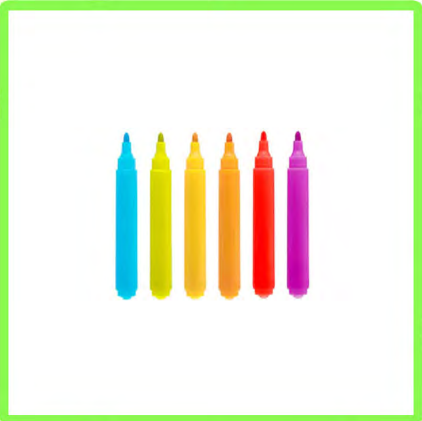
أقلام رصاص ملونة