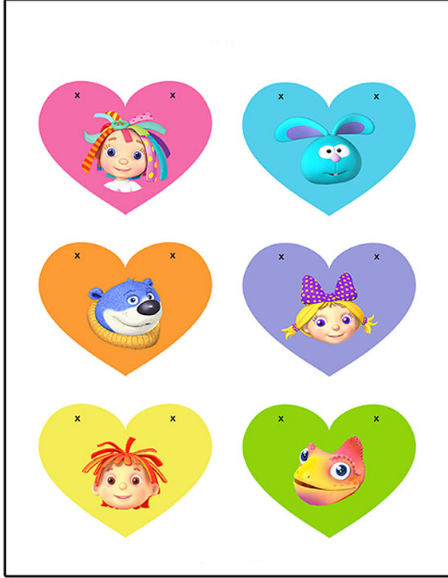
نسخة قابلة للطباعة