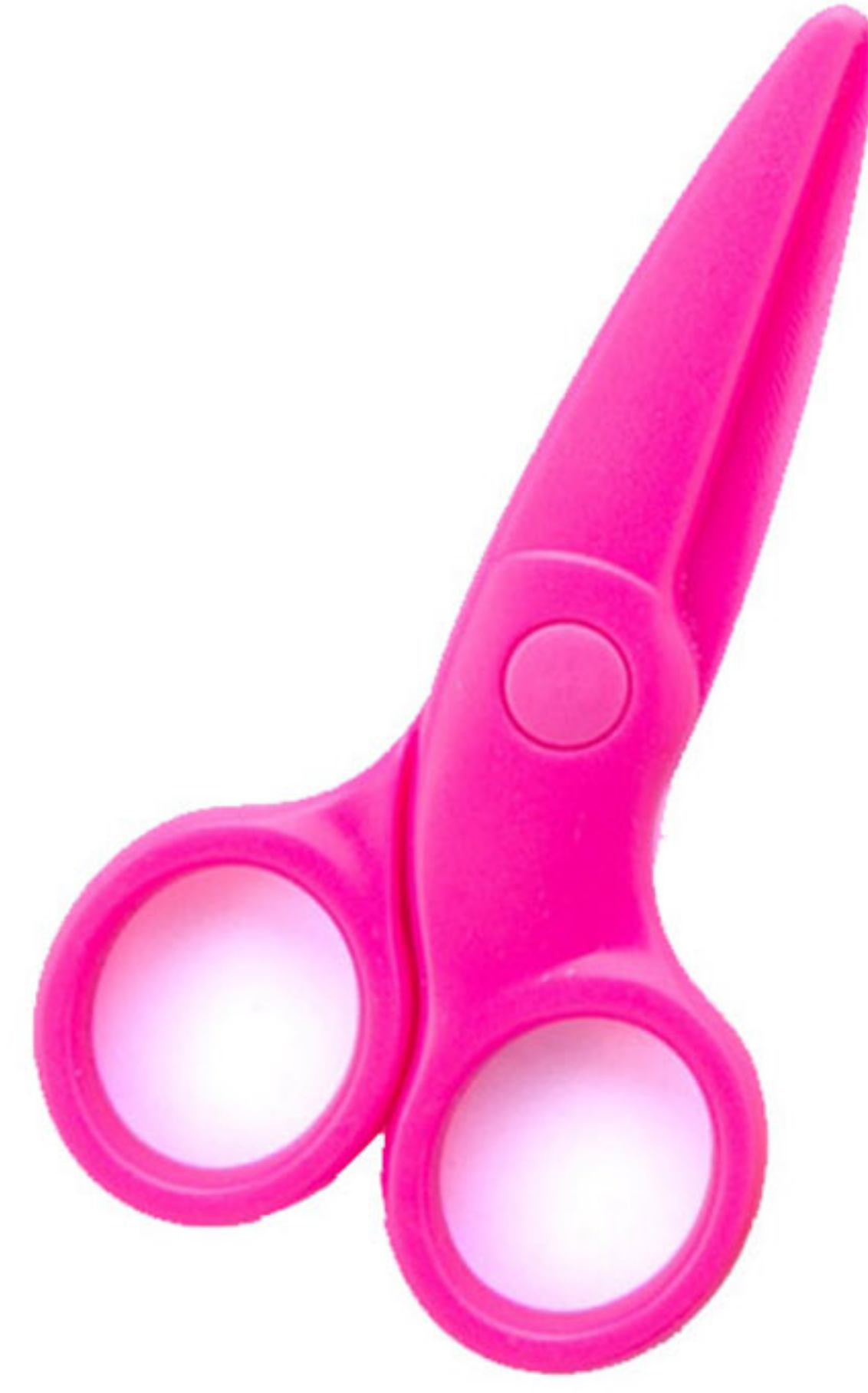
زوج من المقصات