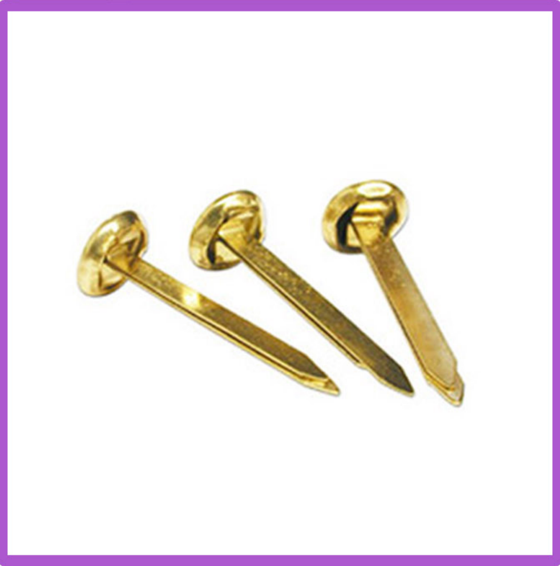
مثبت ورق نحاسي