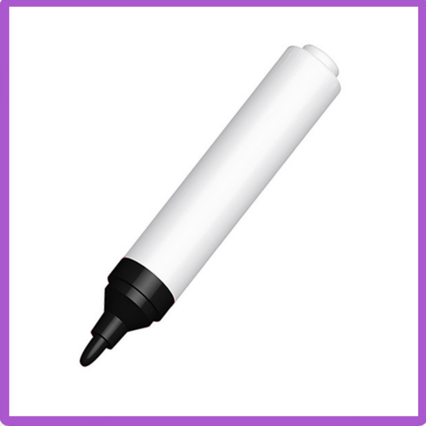
قلم تحديد أسود